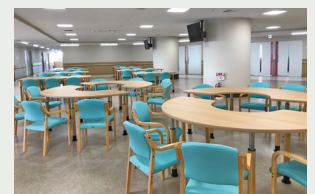
介護老人保健施設 徳州苑▶