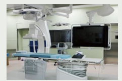
▲ハイブリッド手術室