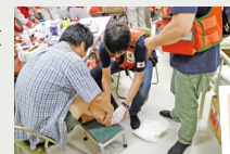
西日本豪雨災害 医療支援活動