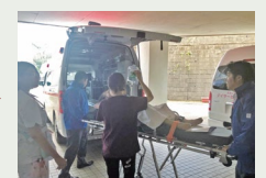
台風15号 大規模停電発生▶