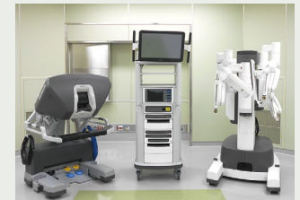
▲内視鏡下手術支援ロボット「ダヴィンチ」