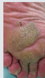
増悪し、足底部に広がった難治性疣贅