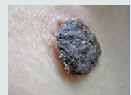
老人性イボ（脂漏性角化症）