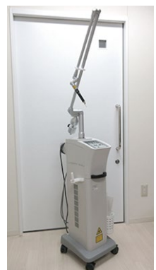
炭酸ガスレーザー（CO 2 レーザー）