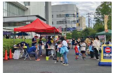
ひよし青空マルシェ