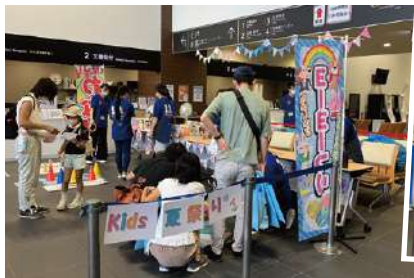
院内は多くの来場者で賑わいました